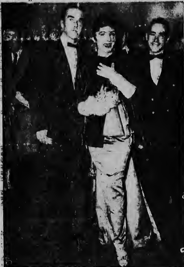
Estrellanan di film Elizabeth Taylor y Montgomery Clift yegando na estreno di "The Last Time I Saw Paris" (E ultimo biaha cu mi ta welta Paris") a New York, cu a tuma lugar na beneficio di hospital North Shore di Manhasset, Long Island. Liz a hunga e papel di principal actriz, den e pelicula aki.